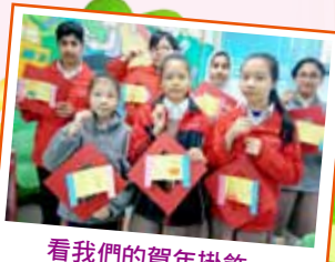
看我們的賀年掛飾，是不是很漂亮呢!