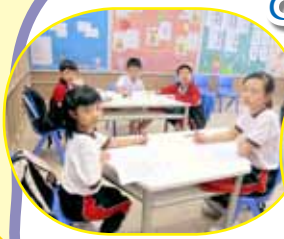
各位同學都很專心地在練習比賽時要寫的字