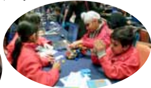
同學們參加了三次機械人工作坊，學習組裝機械人、編寫程式等技巧！