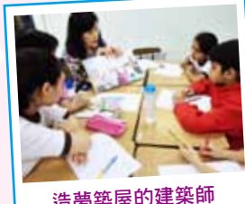
造夢築屋的建築師