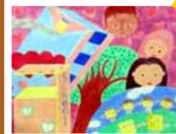
視藝主題學習作品 P5-6