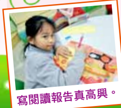
寫閱讀報告真高興。