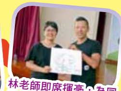
林老師席席揮毫，為同學們的創作思維提供了重要的養分