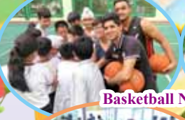
Basketball Never Stops