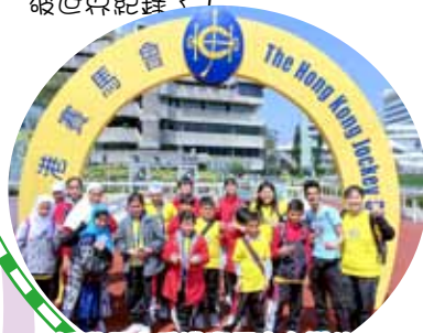
活動是由香港賽馬會主辦的。

在老師的帶領下五、六年級學生參加了由香港賽馬會主辦的「同心創世界紀錄——最長打氣紙圈」活動。在同學們共同努力下，我們終於打破世界紀錄了！