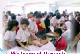
We learned through the activities!