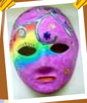
視藝主題 學習作品 P3-4