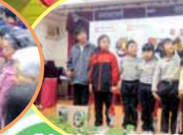
「老幼好薯」種植計劃分享日