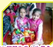
2B 同學作品 8「生果全盒」