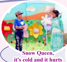
Snow Queen, it's cold and it hurts

繪本作家講座讓學生認識繪本故事的意義。故事戲劇表演讓學生能欣賞別人演繹的故事。學生透過閱讀參與小金牛籌款活動，培養閱讀也可助人的精神。