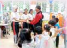
We sang songs and danced with them!