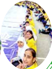
同學同心創世界紀錄！