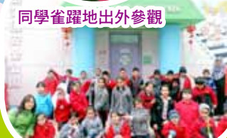
參觀交通安全公園