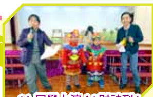
1A 同學上演 80「財神到」

本學年在新春期間以「全盒七十二變」為主題，進行跨學科活動。形形色色的學習活動、集體創作、匯演等項目，貫穿不同的學習領域，除了讓學生對中華文化有更深入的認識外，亦發展他們的研習、溝通、創造、解難等能力。不少學生在活動檢討中表示能從中體驗到團隊精神和合作性的重要，並透過學生互評環節互相欣賞同學在匯演中付出的努力。