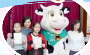
作家工千羊為小金牛籌款頒獎