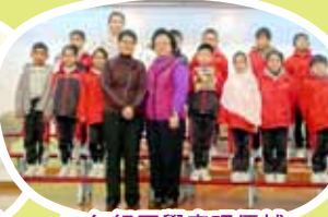
二年級同學表現優越