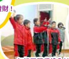
一年級同學很投入地背誦詩詞

古詩擂台是一個全校參與的活動，也是一個比賽。同學們在九月至十二月要學習不同的詩歌，然後在比賽當天朗誦詩歌。