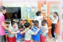
We sang 'London Bridge is falling down!'