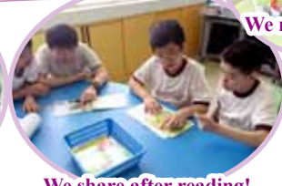
We share after reading!