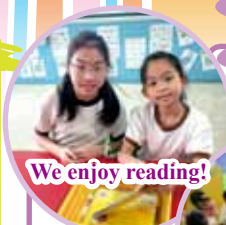
We enjoy reading!