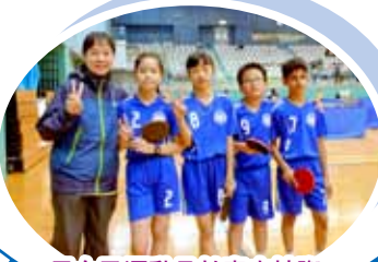
男女子運動員於青衣校際乒乓球比賽合照

本校乒乓球隊隊員參加了青衣區小學校際乒乓球比賽的男子團體賽、男子單打及男子雙打比賽，以及女子單打比賽。各個隊員都力爭上遊，汲取比賽經驗，表現良好。