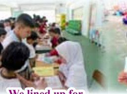
We lined up for the activities!