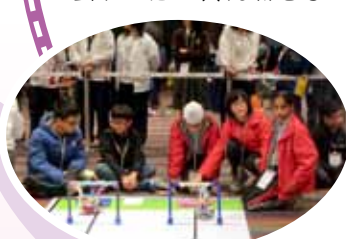
同學非常努力製作，發揮團結精神，埋首想出解決辦法！！

同學們從這次比賽得到的，遠比名次和獎項來得更寶貴，那就是知識、經驗、友誼，還有對科技的熱誠，這些得著都是無價的。這次比賽大大提高了同學對機械科技的興趣，他們也對下一屆比賽充滿信心和期待。