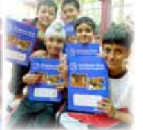
We got folders!