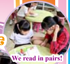
We read in pairs!