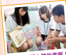
大家都很留心聽故事啊!

讓基層學生參與讀書會。提高學生對閱讀的興趣和學懂欣賞故事內容。學生透過參與閱讀活動，發揮創意。