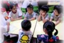
Kids were attentive in reading storybooks!

Trained P.5 and P.6 Reading Ambassadors volunteered to tell stories to kindergarten pupils. Students participating in this community service gained valuable experience of taking care of young learners and were enlightened to learn through challenging activities. The kindergarten pupils participated actively throughout the story time. Both parties had lots of fun.