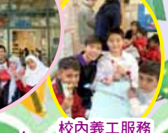
校內義工服務 「世界之友」