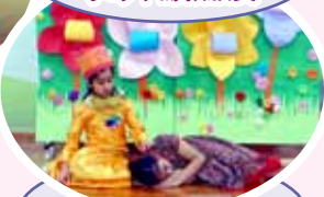
Fall asleep my dear

學生透過參觀活動認識玩具圖書館的獨特設施。在遊戲中學習與人共享的樂趣。在活動中學習自律和守規。