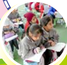
國際互聯網安全日2016活動

本年度全方位學習日主題為「資訊素養」，透過講座及參與「國際互聯網安全日2016」的活動，讓學生增進對安全及負責地使用網上技術的認知。