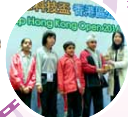
獲得了「最佳美術設計大獎」！