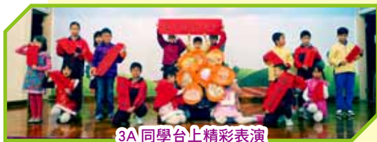
3A 同學台上精彩表演