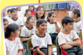
林老師向同學們展示自己的畫作逗得同學們哈哈大笑