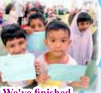
We've finished the activities!