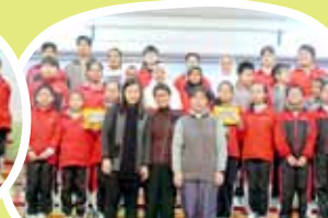
六年級同學齊聲朗讀