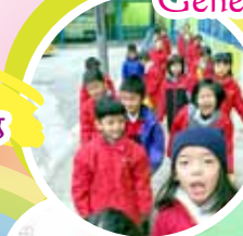
同學雀躍地出外參觀