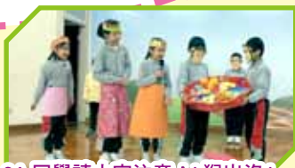
2A 同學請大家注意 80「猴出沒」