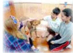
Can you guess what dogs teach us?