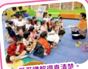
哥哥講解得真清楚。

學生透過參觀活動認識玩具圖書館的獨特設施。在遊戲中學習與人共享的樂趣。在活動中學習自律和守規。