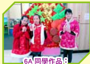
6A 同學作品 8「6A 恭喜恭喜你之 8 變全盒」