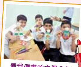
看我們畫的木偶公仔多漂亮啊!