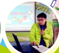
專題探討 - 上網與健康