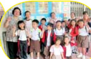
每個同學都衝勁十足，都迫不及待想要開始比賽了呢