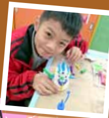
視藝主題 學習作品 P1-2

P.5-6 共融校園新世界 (New era of school intergration)