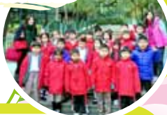
參觀香港動植物公園