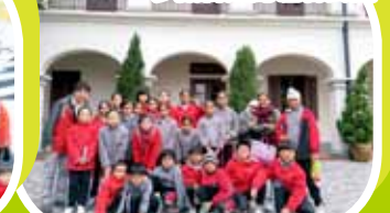
參觀屏山鄧族文物館