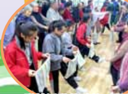
聯校活動共融義工服務