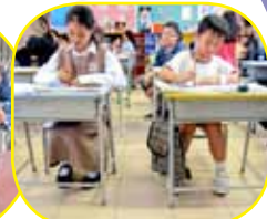
還有一些時間，先來練練字吧！