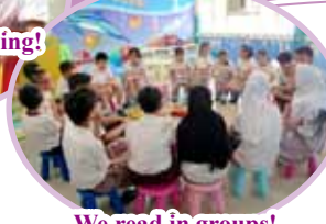
We read in groups!