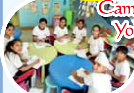
We practised oral skills!