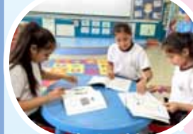
We practised writing skills!

Students engaging in the preparation of Cambridge English: Young Learners developed confidence and improved their English progressively. Both levels, Movers and Flyers, are fun and have motivating English language tests that focus on all four fundamental English skills speaking, listening, reading and writing.