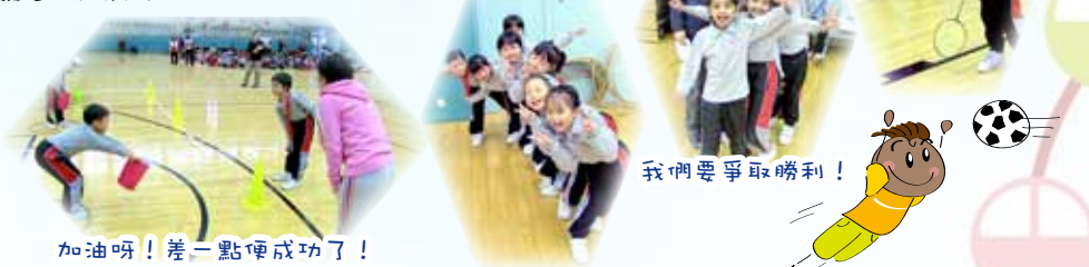
加油呀！差一點便成功了！

同學們在青商運動會中，既能參加競技遊戲比賽，也能參與不同的體育活動，大家玩得興高采烈，度過了一個既刺激又難忘的時刻。