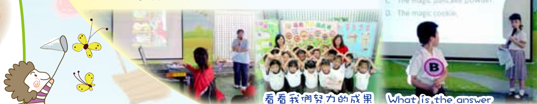
看看我們努力的成果