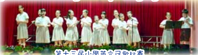
第十三屆小學英文民歌比賽

The 13 th Hong Kong Inter Primary School English Folk Song Group Singing Contest