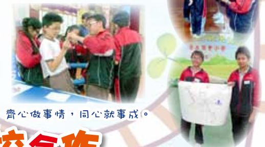
齊心做事情，同心就事成。