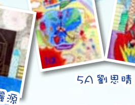
至 FIT 組合