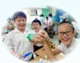
看看我們的水火箭！