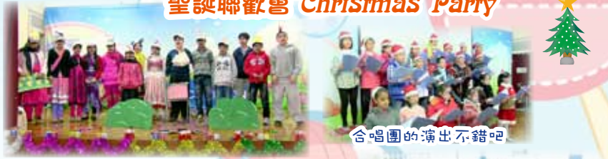
合唱團的演出不錯吧