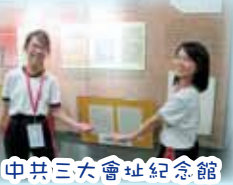
中共三大會址紀念館

本校於五月份參加由教育局主辦之「香港初中及高小內地交流計劃」藉著參觀廣州的西式建築物，從而探究其歷史文化背景。我們參觀了石室聖心大教堂、沙面建築群、東山花園洋樓群、廣州近代史博物館及中山紀念堂，同學們在是次的參觀活動中，不但了解廣州的文物保育工作，更認識了中國近代的重要歷史人物及事件，加深對保護國家文物傳授的關注。