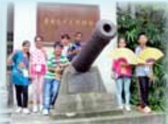
到訪廣州近代史博物館